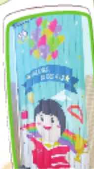
「喜閱者喜悅，善閱者卓越」， 寓意深遠。