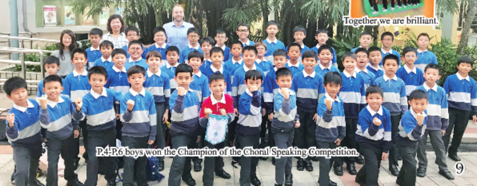
P.4-P.6 boys won the Champion of the Choral Speaking Competition.