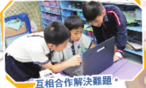
互相合作解決難題。