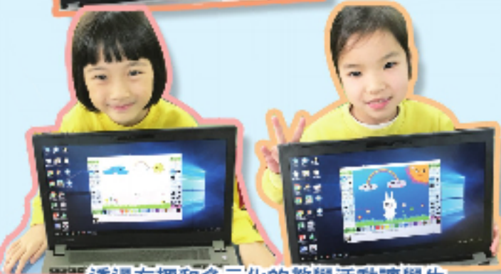
透過有趣和多元化的教學活動讓學生學習軟件的操作。