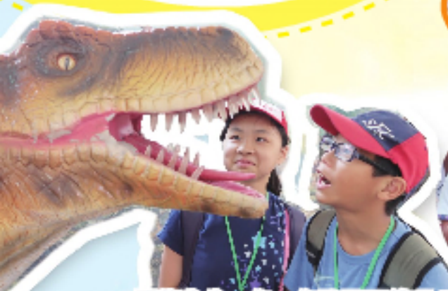
恐龍先生，您……您肚子不餓吧！！ (自貢恐龍博物館)