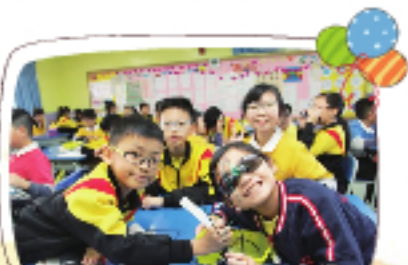
STEM課程-P5的盲人避障器。