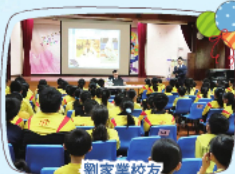
劉家業校友 (大埔區助理指揮官)的經驗分享。