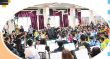
樂韻播萬千音樂會