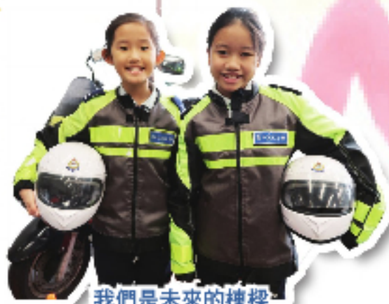
我們是未來的棟樑