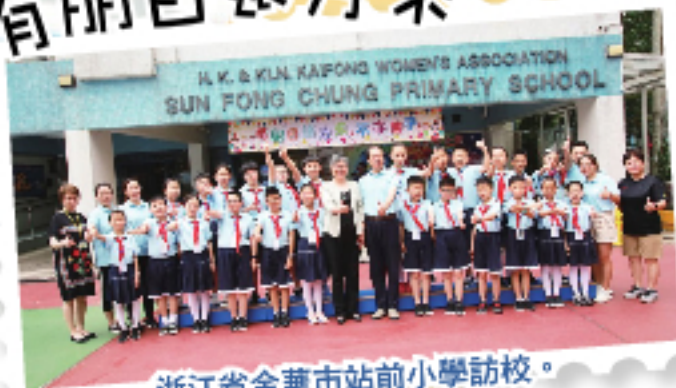
浙江省金華市站前小學訪校。