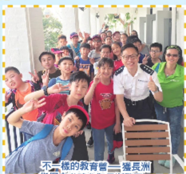
不一樣的教育營——獲長洲指揮官邀請參觀長洲警署。