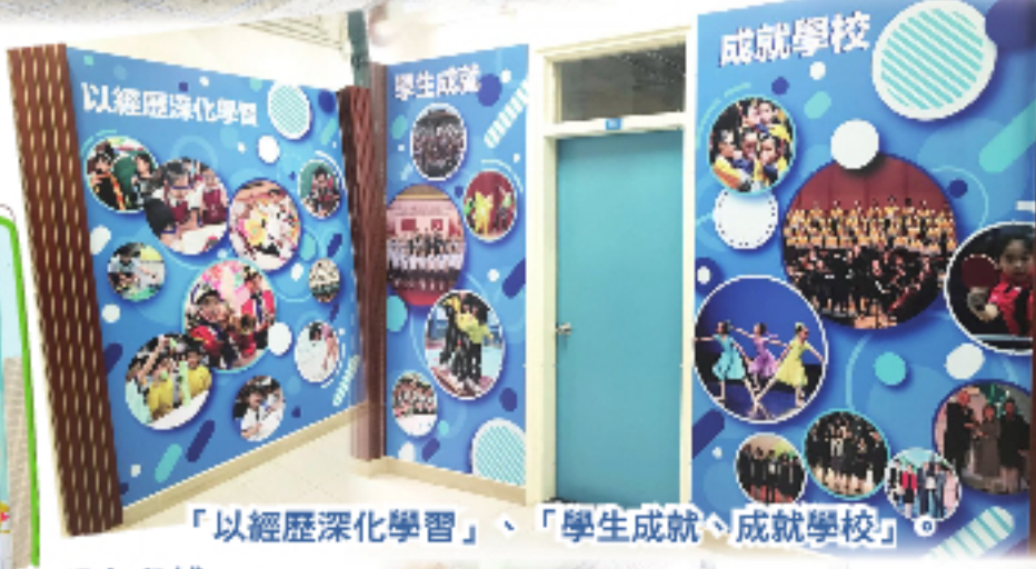
「以經歷深化學習」、 「學生成就、成就學校」。