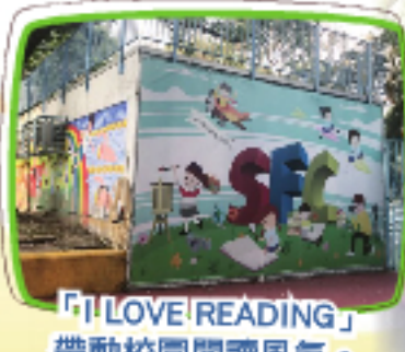
「I LOVE READING」 帶動校園閱讀風氣。