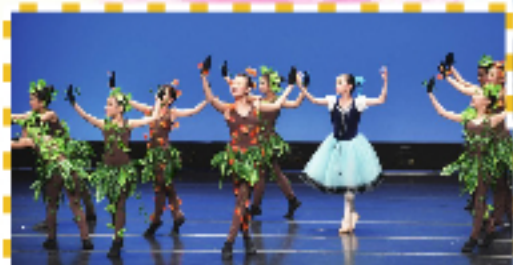
一致的眼神和動作，都是同學們經過長久訓練的成果。