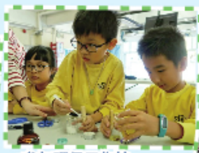
參加環保工作坊，把廢物變成有用的東西。