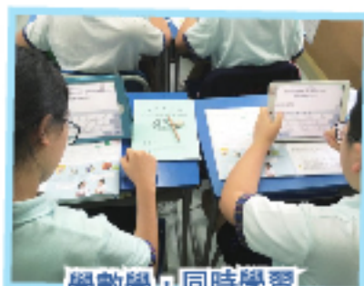
學數學，同時學習使用不同的電腦軟件。