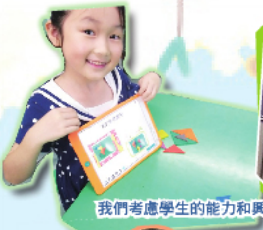
我們考慮學生的能力和興趣，以及科技發展的趨勢來規劃、調整課程。