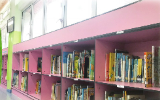
圖書館書架換上粉色新妝。