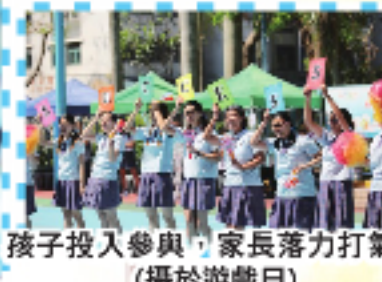
孩子投入參與，家長落力打氣。 (攝於遊戲日)