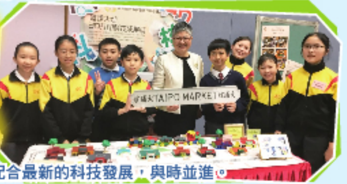
學習內容能配合最新的科技發展，與時並進。