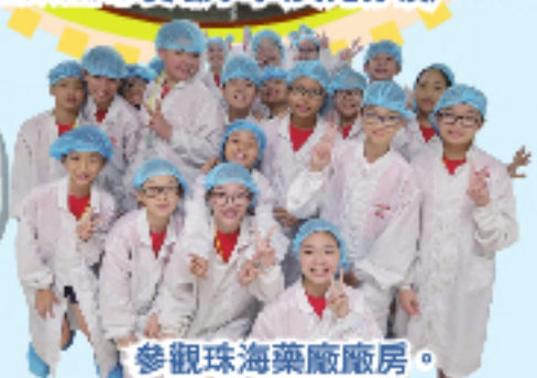
參觀珠海藥廠廠房。