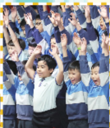
集誦隊無論帶來一片「藍」海，還是一片「男」海，也同樣吸睛。