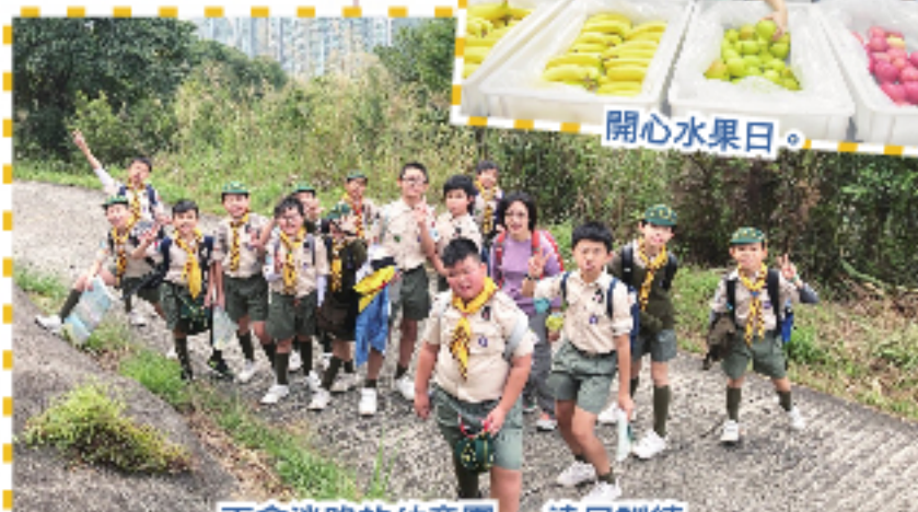
不會迷路的幼童軍——遠足訓練