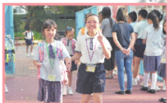
「手牽手計劃」協助小一新生適應校園。