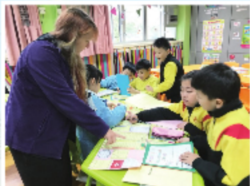
P.3 students learnt about different countries and made a lapbook.