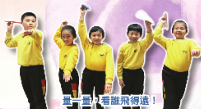
量一量，看誰飛得遠！