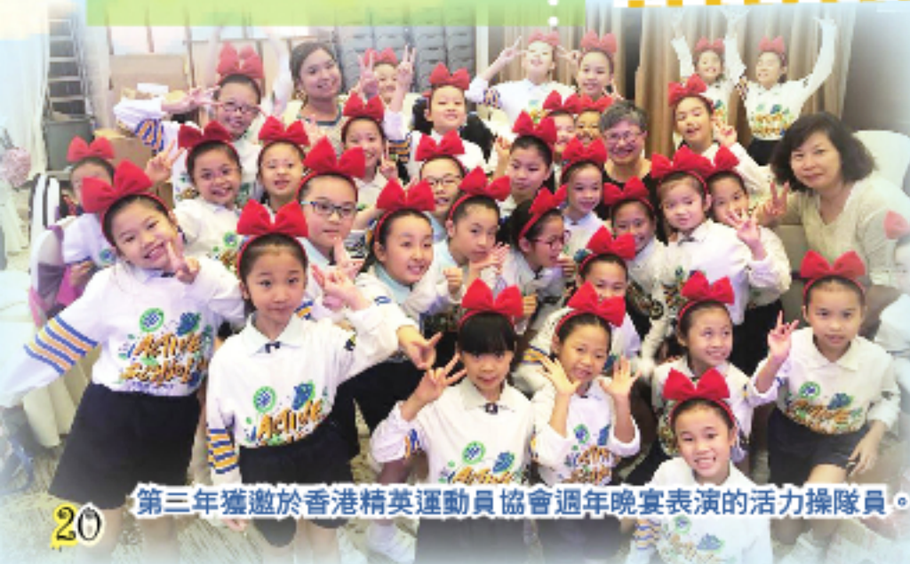
第三年獲邀於香港精英運動員協會週年晚宴表演的活力操隊員。