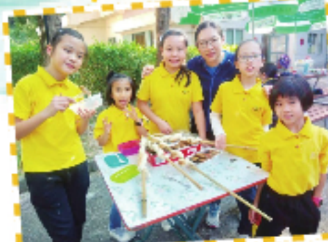
學習野外烹飪的小女童軍。