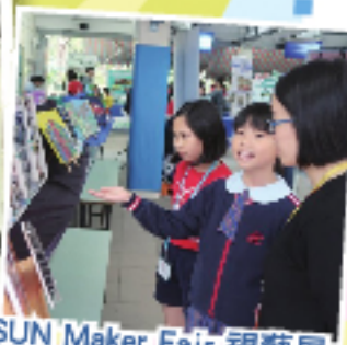
SUN Maker Fair 視藝展