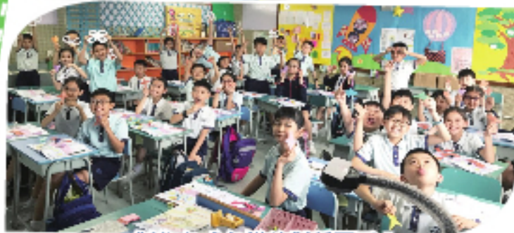
製作各式各樣的對稱圖形！