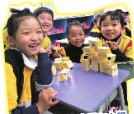
自製層層疊，探究度量和力學。