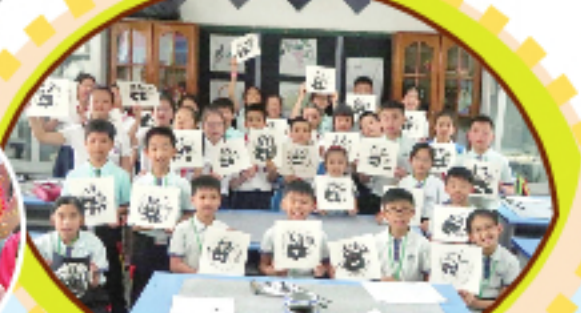
探訪成都市實驗小學(文苑分校)。