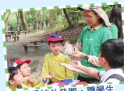
透過校外參觀，讓學生親身感受大自然的美。