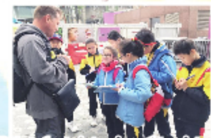
P.6 students interviewed tourists at the Peak.