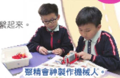
聚精會神製作機械人。