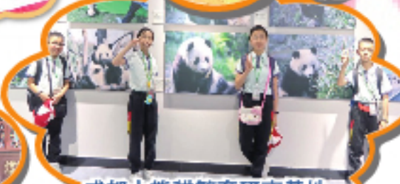
成都大熊貓繁育研究基地