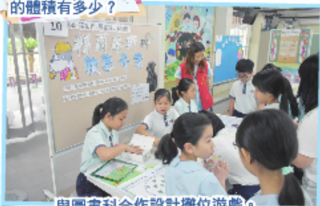
與圖書科合作設計攤位遊戲。