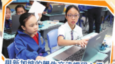
與新加坡的學生交流編程心得。