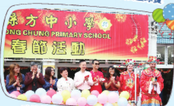
孔校董及校友執委參與新春行大運