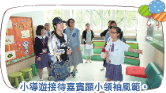
小導遊接待嘉賓顯小領袖風範。