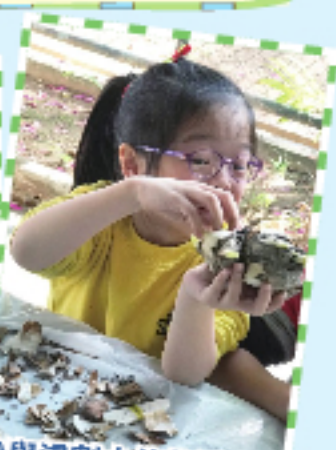
參與浸剖水仙花活動。