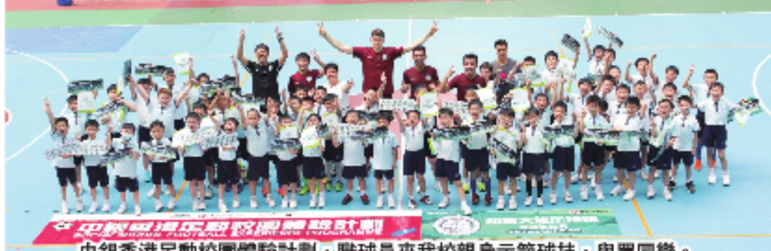
中銀香港足動校園體驗計劃，戰球員來我校親身示範球技，與眾同樂。