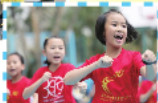
運動帶來健康與智慧。