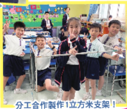
分工合作製作1立方米支架！