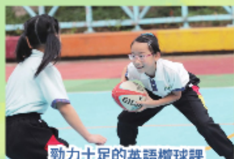
勁力十足的英語檯球課