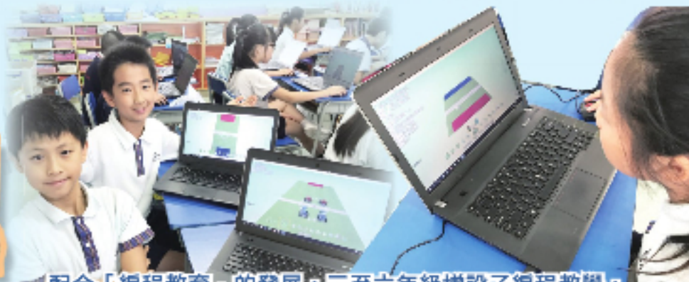
配合「編程教育」的發展，三至六年級增設了編程教學，提升學生的運算思維、探究和解難能力。