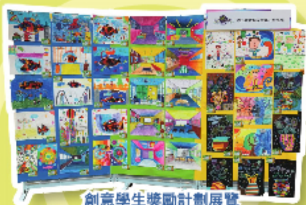
創意學生獎勵計劃展覽

運用社區資源，鼓勵學生參與校外藝術計劃，如校園藝術大使、創意學生獎勵計劃等。邀請不同的藝術家到校進行工作坊，擴展學生的多元視野，豐富學生的視覺藝術經驗。