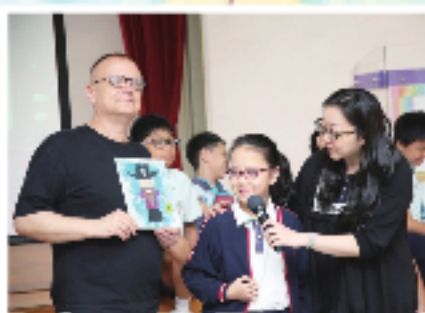
Look at my Egg-Tempura artwork!

P.3 and P.4 students cooperated with their classmates when using i-Pad and doing group work. They built up trust and friendship among themselves.