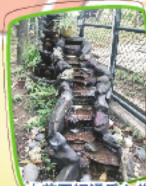
小花園經過悉心佈置，另有一番景象。