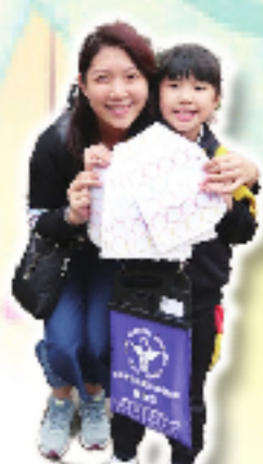
親子賣旗服務社群。