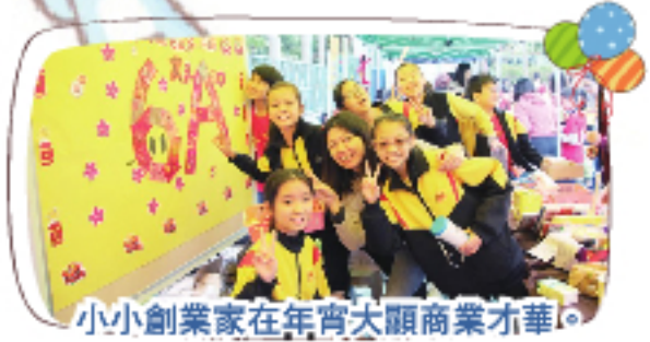
小小創業家在年宵大顯商業才華。