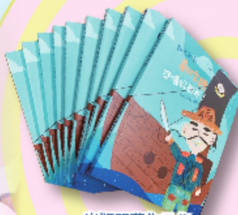
出版視藝作品集 《報告船長，創作號準備好啟航》