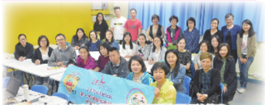
「新一代健康成長錦囊」家長教育課程結業禮。