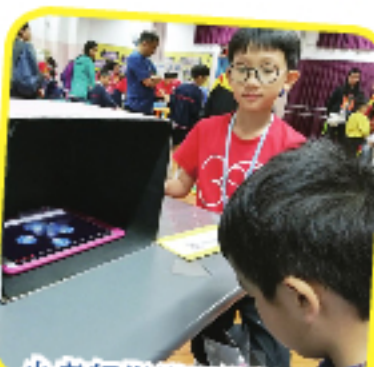
小老師指導同學製作3D 投影機呢。