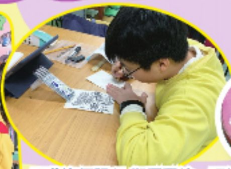
視藝資優課程-塑膠膠繪、禪繞畫小組