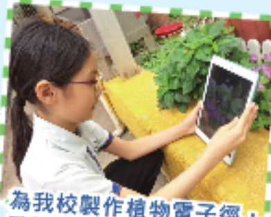
為我校製作植物電子徑，讓學生了解校園植物。