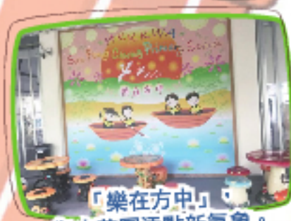
「樂在方中」 為小花園添點新氣象。