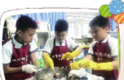
科探小組進行實驗中。