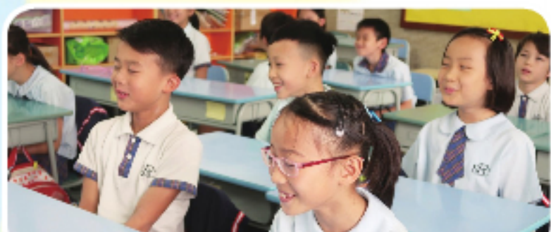
慈心四願課程：快樂感、安全感、自在感、身心健康。