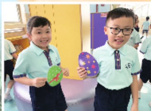
Let's find the eggs in the Egg Easter Hunt!