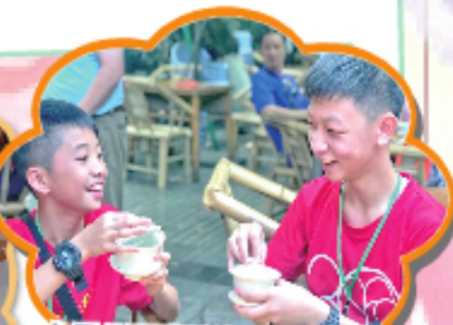
人民公園乘乘涼，嘆茶慢活。