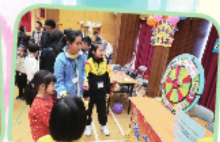
嘉年華攤位義工講解遊戲規則。