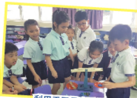
利用天平量度重量。