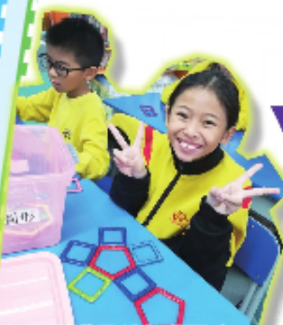
這能拼成哪種立體圖形呢？