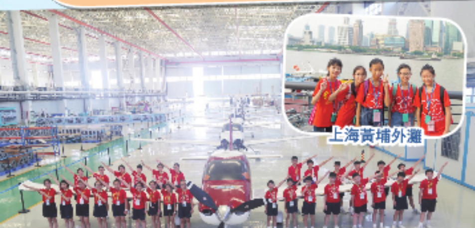
參訪愛飛客航空科普基地