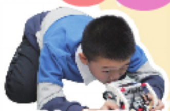
成功的其中一個關鍵——精準！