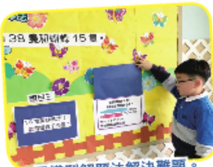
用模型解題法解決難題。