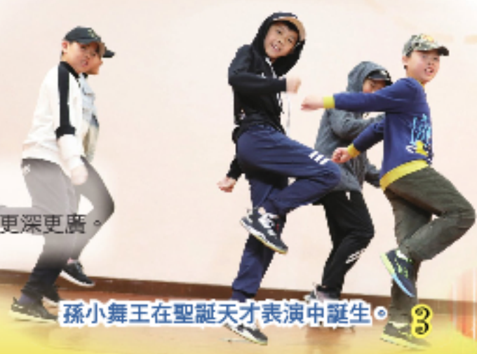
孫小舞王在聖誕天才表演中誕生。