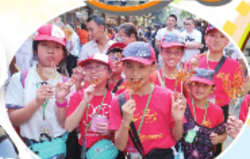
來寬窄巷子，品嚐地道小吃。