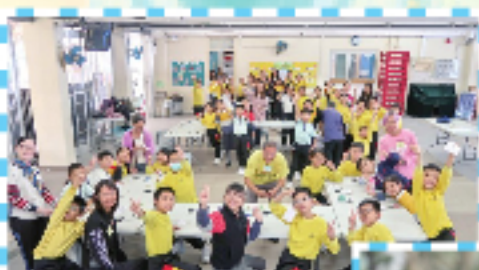
藝術大使為大家介紹同學作品。