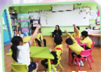
「快樂諧達人」小組，同學們積極參與分享。