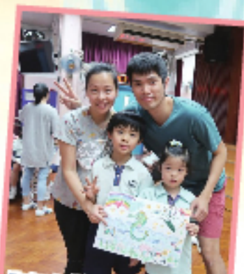
「家庭樂Fun Fun」親子分享溫馨家庭畫作。