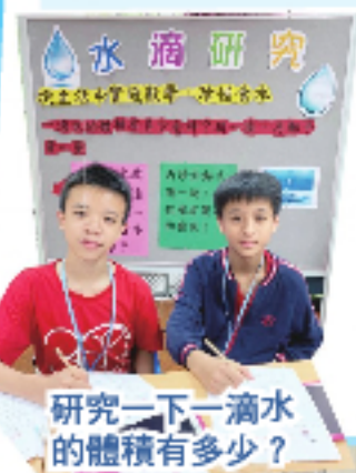
研究下一滴水的體積有多少？