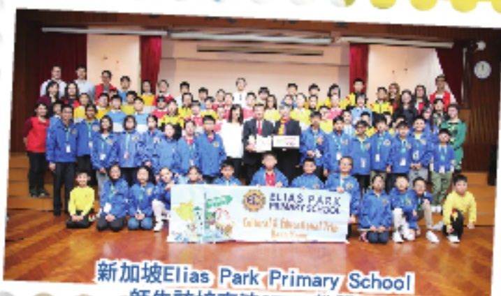
新加坡Elias Park Primary School 師生訪校交流STEM教學。