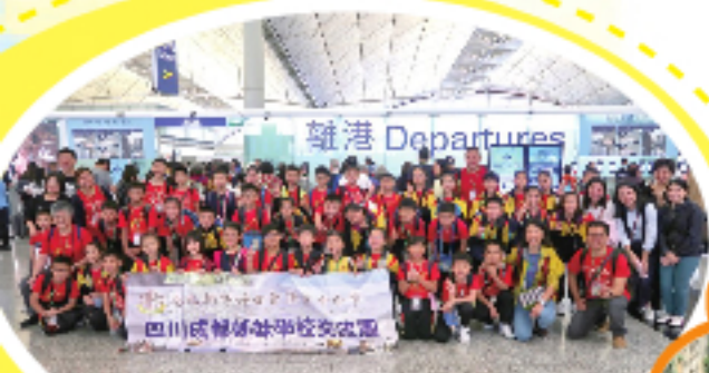
齊裝待發，成都我們來了！