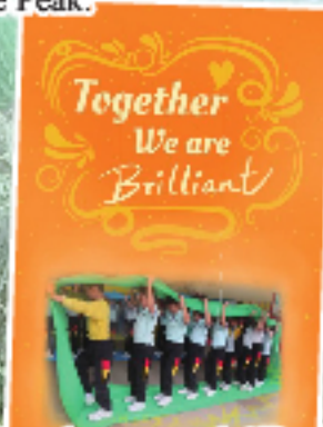
Together we are brilliant.