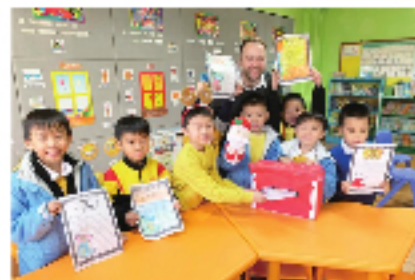
P.1 students sent letters to Santa Claus.