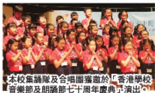
本校集誦隊及合唱團獲邀於「香港學校音樂節及朗誦節七十周年慶典」演出。